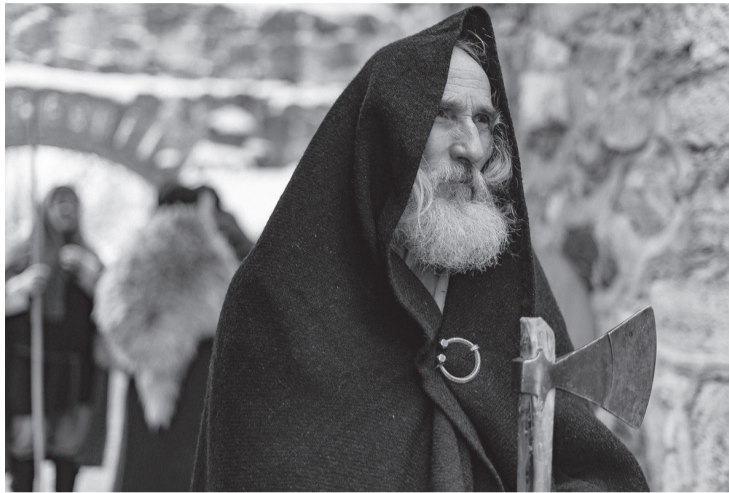
Filmo „Baltų gentys. Paskutiniai Europos pagony“ kadras

Lietuviui prūsas yra nuo skriaudėjo rankos kritęs (pabrėžkime šį žodį) brolis. Prūsų ir baltų kaip gąsdintojų ar net