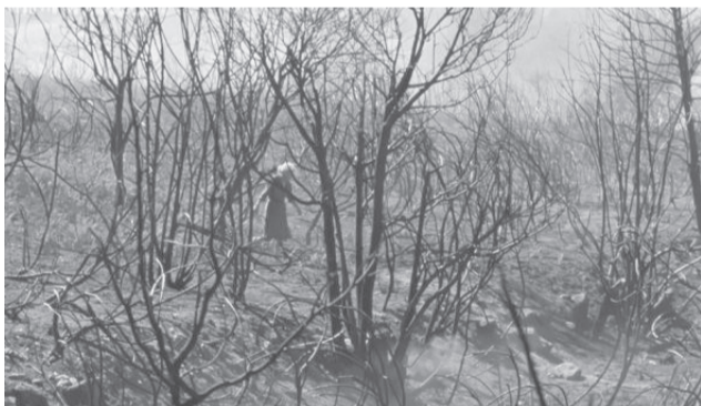
Kino filmo „Ugnis ateis“ kadras

„Kino pavasariui“ įvykus, tačiau kitaip nei įprasta, norisi aptarti vieną asmeninį festivalio atradimą – filmą „Ugnis ateis“. Aktualios jautrumo aplinkai temos šiame režisieriaus Oliverio Laxės vizualiaame pasakojime atskleidžiamos empatiškai ir be primestos didaktikos. Todėl išjungus ekraną norėjosi toliau panagrinėti žiūrint filmą kilisius asmeninės ir socialinės ekologijos klausimus.