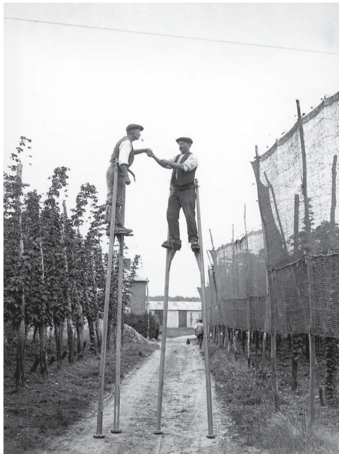
Apynių rinkėjai. Anglija, Kentas. 1928

Šviesų linksmybė dangumi vis bėga, vėjo genama, sausą šaką po manimi nulūžta net nekertama.