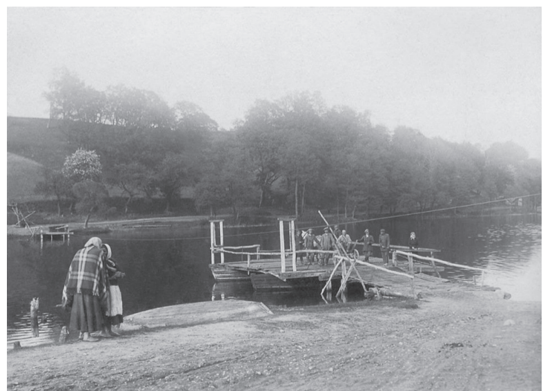
Keltas per Asveją. 1929