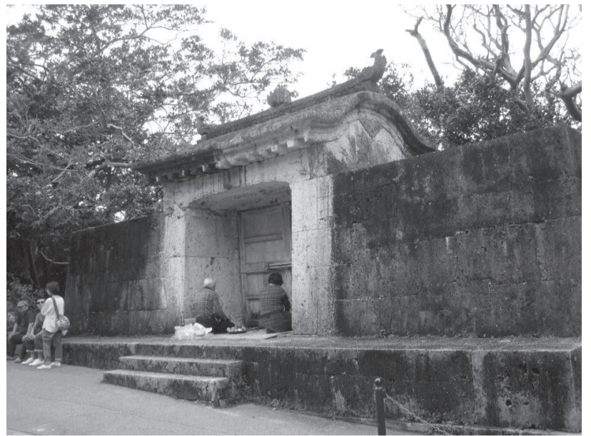
Maldykla netoli Šiuri pilies

Vis dėlto klyščia teigdamas, kad Riūkiū salos, valdytos japonų, vėliau – ketvirtį amžiaus – amerikiečių, o nuo 1972 m. – vėl japonų, yra visiškai praradusios savo tapatybes. Šalia makdonaldų ir sušinių rasi ir okinaviško maisto (šis savo ruožtu paveiktas kinų ir Pietryčių Azijos šalių, su kuriomis Riūkiū prekydavosi), riūkiūjiečiai vis dar mieliau išpažįsta savo tikėjimą, kuriame pabrėžiama darna tarp gyvųjų ir mirusiųjų bei atliekamos šamaniškos apeigos, nei lenkiasi šintoizmo dievams, Budai ar meldžiasi bažnyčiose; kitokios spalvos čia namų stogai, neretas moka vietinių šokių ir bent vieną liaudies dainą, vartojamojoje japonų kalboje primaišyta prosenių kalbų žodžių