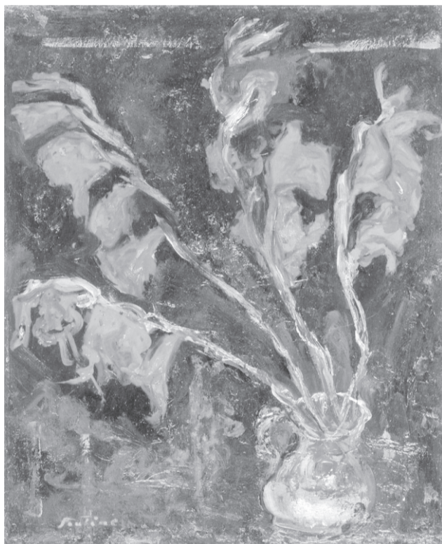
Chaïm Soutine. Gladiolės. 1919

Léonas-Paulis Fargue'as (1879–1947) – prancūzų poetas ir prozininkas, Stéphane'o Mallarmé ir Henri Bergsono mokyns, Alfredo Jarry bendramokslis, bendravęs su André Gide'u, Pauliu Claudeliu, Maurice'u Raveliu (pastarasis sukūrė dainą pagal Fargue'o eilėraščių „Svajos“). 1924 m. kartu su Pauliu Valéry ir Valery Larbaud įsteigė literatūros žurnalą Commerce . Gimęs ir miręs Paryžiuje, aistringai jį mylėjęs, Fargue'as buvo puikus šio miesto kronikininkas. Čia spausdinamos ištraukos iš knygos „Pėsčiomis po Paryžių“ ( Le Piéton de Paris , 1939), sudarytos iš reportažų, 1935–1936 m. spausdintų žurnale Voilà .