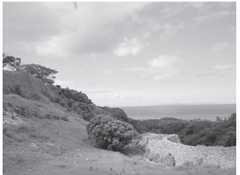
Kunigamio regione esanti į UNESCO Pasaulio paveldo sąrašą įrašyta Nakidžino pilis. Tiksliau, kas iš jos liko. Iki XV a. (nesuvienytos Riūkiū karalystės laikais) iš šios pilies buvo valdoma Hokuzano kunigaikštystė

ir konstrukcijų. Tačiau vietinės kalbos vis dar yra nuvertinamos, būdinga tai, kas vadinama kultūrinio nevisavertiskumo kompleksu (angl. cultural cringe ). Tai man priminė pasakojimus, kaip Vincas Kudirka iki tautinio susipratimo gėdydavosi kalbėti lietuviškai arba kaip į mane lyg trolintoją žiūrėjo Plungės geležinkelio stoties darbuotoja, kai aš prabilau žemaitiškai. Okinavoje iš vienos pusės dėl turistinių priežasčių regiono išskirtinumą vis bandoma pabrėžti, iš kitos pusės – tai daroma atsargiai, neretai šlampuoti, o kartais ir neįtikėtinais atsainiais – trumpuose užrašuose pasitaiko įvairių klaidų, o traukinyje Nahoje apie kitą stotelę okinaviškai pranešama su labai grubia gramatine klaida. Galų gale prefektūros valdžia yra paskelbusi sieksianti kas metus didinti vietinių kalbų vartojamumą. Tačiau kaip tai padaryti, kai atsakingieji už švietimą nė girdėti nenori bent apie simbolišką vietinių kalbų įtraukimą į mokymo programas, – mįslė. Dar prieš penkiolika metų prefektūroje būta valdininkų, kurie teigė, kad Riūkiū kalbos yra bevertės, nes tai tesanti iškraipyta japonų kalba su išlaikytais archaizmais.