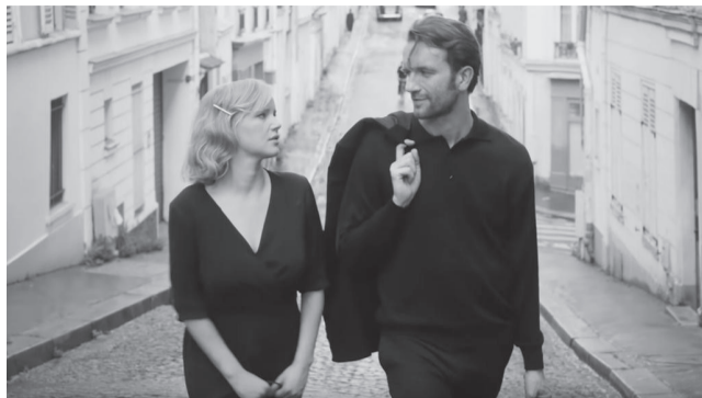
Kino filmo „Šaltasis karas“ kadras

Lenkijos kinas visuomet garsėjo ilgametėmis tradicijomis ir garsiais režisieriais bei kitais menininkais, kurie patenka į garbingus Europos bei pasaulio autorinio kino kūrėjų sąrašus. Lenkų kinas nuo pat Pirmojo pasaulinio karo buvo transnacionalinis, rodomas kitose Europos valstybėse ir taip užsitarnavo savo vardą. Vieną didžiausių įtakų šalies kino tradicijos formavimuisi padarė 1948 m. įkurta prestižinė Lodzės kino mokykla, joje, nors Lenkija buvo kontroliuojama Sovietų Sąjungos, išugdyti garsiausi šalies kūrėjai sulaukė tarptautinio pripažinimo: Andrzejus Wajda, Romanas Polanskis, Krzysztofą Zanussis, Krzysztofą Kieślowskis ir kiti. Ši aukštoji mokykla ir jos alumnai plėtojo Lenkijos nacionalinio kino idėją, tapatybės klausimus, nebijodami kalbėti ir apie realybę gyvenant socialistinėje santvarkoje – žinoma, tokius filmus buvo sunku išgelbėti nuo cenzūros kirčio. Vis dėlto paradoksalu, kad net pati valdžia prisidėjo prie Lenkijos kino tradicijos kūrimo: statyti komerciniai ir art house kino teatrai (vien Lodzėje 7-ajame dešimtmetyje veikė 36 kino teatrai), kuriuose rodyti filmai iš viso pasaulio, tarp jų prancūzų komedijos ir netgi kai kurie amerikiečių filmai. Galbūt būtent tai, kad Lenkija netgi komunistiniu laikotarpiu sugebėjo išlavuoti tarp paklusnumo valdžiai ir saugaus savo tautinio identiteto plėtojimo kine, padėjo iki šių dienų išlaikyti stabilią kino industriją ir ryškų jos veidą.