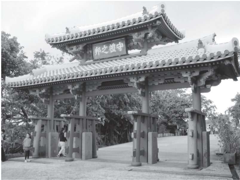
Vartai į Šiuri pilį