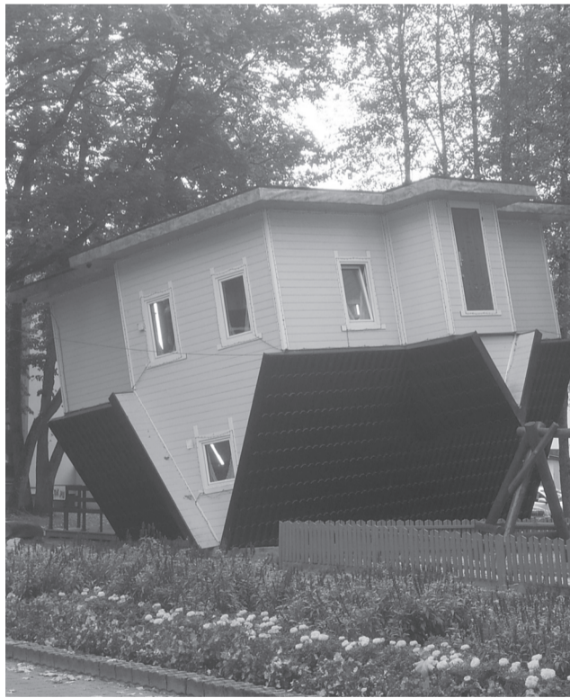
Rasti namai. Druskininkai.