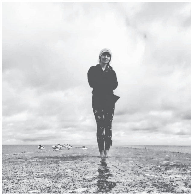
Ant Nidos molo. Aš ir užsienietės antys.

– Kur einate? – Į Nidą. – Gal jus pavežti? – Ne, ačiū, aš nusprendusi eiti. – Ach, aišku, jūs tikslas eiti. – Taip, toks tikslas. Dieną pamiegojau, dabar turiu energijos, tai einu.