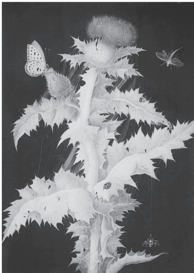
Barbara Regina Dietzsch. Dagio šaka su drugeliu, laumžirgiu, boružėle ir voru. 1777