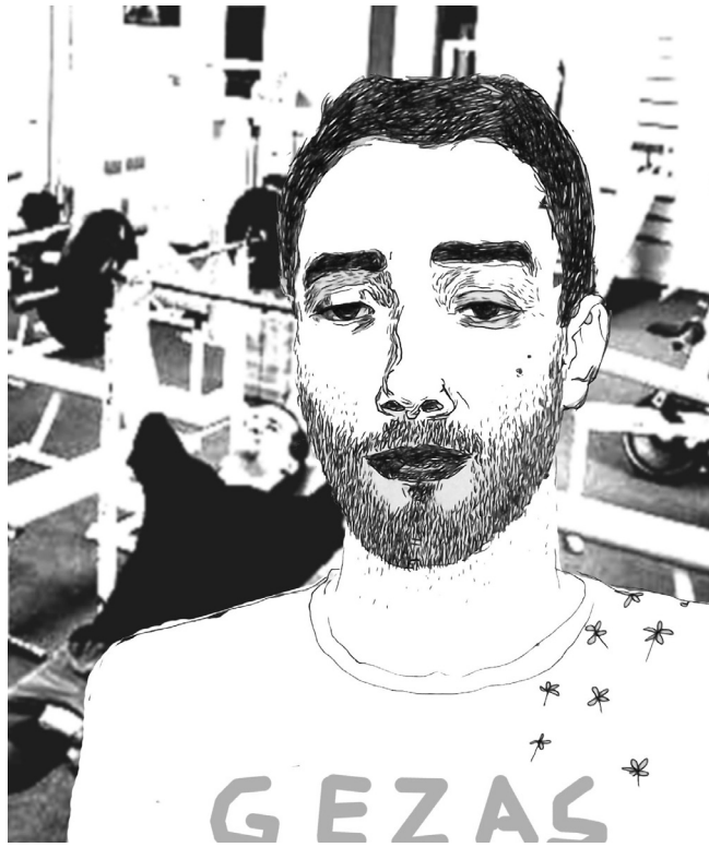
Jolitos Puleikytės piešinys

Baigdamas: mokslininkai įrodė, kad šis kūrinys nuostabus. Ypač pirmasis jo sakiny.