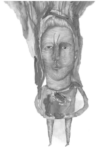
Mariaus Samavičiaus piešinys