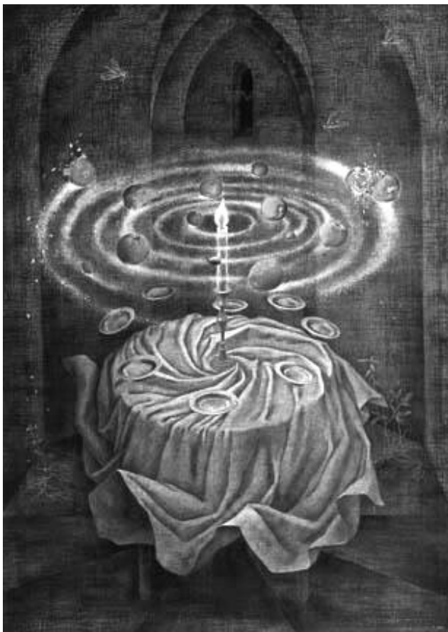
Remedios Varo. Gyvenimo atnaujinimas. 1963

romanus, pasižiūri į paskutinius puslapius, pamato atomazgą ir toliau nebeskaito.