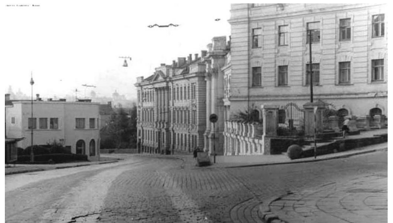
Jono Basanavičiaus ir Mindaugo gatvių sankryžoje riogsojės granito rutulys

Tokiomis aplinkybėmis dar įdomesnis tampa kone sakralios lenkų meilės Vilniui fenomenas. Jo nepaaiškinsi tik nenoru susitaikyti su Vilniaus praradimu ar netekties skausmo penima nostalgija. Kad ir kaip nemalonu būtų pripažinti, istorijos mitams atviresni lenkai greičiausiai bus išsiugdę ir geresnę istorinę atmintį. Tai puikiai atskleidžia „pamirštųjų karių“ mitas. Jei kartas nežinote, tai „pamirštaisiais kariais“ Lenkijoje vadinami pogrindžio kovotojai, 1944–1963 m. gynę šalies nepriklausomybę ir priešinęsi jos sovietizacijai. „Esu lenkas ir visada juo būsiu. Nužudėte man Pileckį** ir aš jūsų, kurvų, nekenčiu“, – stūgauja budulis buitinio konflikto metu ir užsipuola kaimynystėje gyvenančią rusę. Šioji išpuolį nuflmuoja, o įrašą išplatina vienas įtakingiausių Lenkijos dienraščių. Incidento būta tikrai šlykštaus ir galbūt nederėtų jo pateikti kaip pavyzdžio, tačiau jis puikiai atskleidžia šiuo metu ypač išryškėjusį „pamirštųjų karių“ mito paveikumą. Na niekaip neįsivaizduoju kokio mūsų pusgalvio panašiomis aplinkybėmis rypaujančio dėl pokariu nužudytų partizanų. Net Adolfo Ramanausko-Vanago metams pasibaigus.