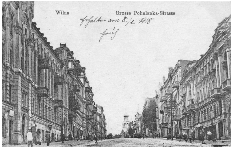
Pirmojo pasaulinio karo laikų atvirukas su J. Basanavičiaus gatvės vaizdu

Jeigu kada pėsčiomis kilsite J. Basanavičiaus gatvę viršų, pasidarykite pramogą, paskaitinėkite iškasas. Dešiniojoje gatvės pusėje praeisite „City Chef Barbecue“, „Reformatai Park Hotel“, „Klerr“, „Expressive Coffee & Gourmets“, „Mad Beauty Squad“, „Fishop“. Maždaug ties šia sąrašo vieta aš jau būnu parėjusi namo, tačiau neabejoju, kad likusioje gatvės atkarpoje rastumėte, kuo jį papildyti. Tiesa, įvairios maitinimo įstaigos atsiranda ir dingsta tokiu greičiu, kad kai nuspręsite ta gatvę pasi-vaikščioti, pavadinimų sąrašas gali būti visiškai kitoks. Iš mano jau dingio „Mama food – take away“ ir „Sushi Stop“. Pastarosios užkandinės net pasigendu. Kartu su šalia esančia žuvies parduotuve jų iškabos buvo puikus kalambūras („Fishop / Sushi Stop“). Klausiate, kokia tų pavadinimų fiksavimo prasmė? Man tai savotiškos lažybos. Spėliojau, kiek prireiks laiko, kol tarp visų iškabų lietuviškai liks užrašyta tik viena – „Lietuvos kultūros ministerija“. Žinoma, dar lieka „Lietuvos rusų dramos teatras“, bet šis užrašas taip aukštai, kad dažniausiai nė nepastebimas. „Vakarietiško“ proceso stabdo ir dvi dailės galerijos, gan giliai „išiinkaravusios“ į lietuvių kalbą. Kai visi ar bent dauguma pavadinimų taps angliški, eilinės kultūros nakties metu bus galima pasiūlyti J. Basanavičiaus gatvėje žaisti papildytos realybės žaidimą – vietoj pokemonų gaudyti nebeegzistuojančius lietuviškus pavadinimus, iškasas, užrašus meniu lentose. Žaidimą pavadinčiau „Patriarchas“.