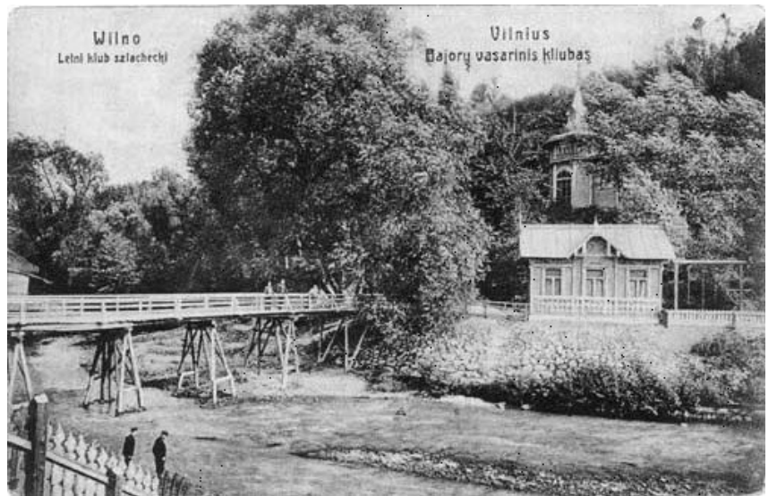
Basarų vasaros klubas dešiniajame Vilnios krante. XIX a. pab.

Sereikiškių parke siūloma statyti arbatinę prie Bernardinų sodelio, oranžeriją-restoraną prie botanikos sodo, muzikos paviljoną prie pagrindinės aikštės, belvederio kioską, vietą komerciniams renginiams, trejus rakinamus parko vartus, ledainę, tiltelį prie tvenkinio, kuriame vasarą veiktų fontanai, o žiemą – čiuožykla, paauglių žaidimo aikštelė. (Tiesa, o kur nusprūdo daug kam atmintina rotunda ir jos aplinka? O ponų teniso kortams greta draustinio išties ne vieta.) Esą bus restauruojami tvenkiniai, belvederio kalnelis, alpinariumas, rožynas, „įrengti simboliniai, edukaciniai bernardinų vienuolyno daržas, botanikos sodas“. Pagal pateiktą sumanyto planą, būdingas jo detales ir kvėšai lengvatikiui turėtų būti aišku, kad dauguma būsimųjų parko statinių ir pertvarkymų „turėtų atitikti planuojamo parko charakterį (!)“. O kitas teiginys tiesiog išviešina istorinio parko su buvusią takų sistema at-