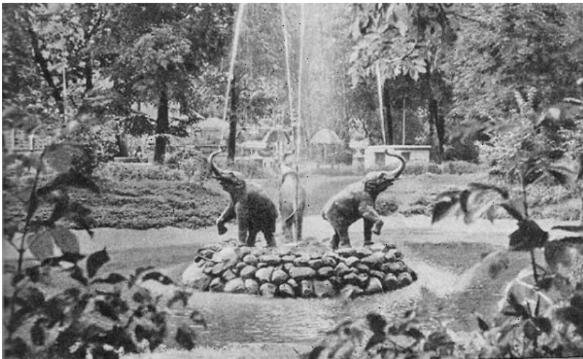
Fontanas su trimis drambliukais Jaunimo sode. Apie 1960 m.

Susidūrę su pasipiktinimu, ašmenų nukreipėjai suka uodegas – išpjausią tik apie 30 nuošimčių nevertingų, ligotų medžių. Bet tokių tarp nuverstųjų reta. Kai peržiūri šio cunamio medgalių strampus, matai, kokie gyvybe trykštantys, sveiki kaip pirmadieniai baravykučiai jie pūps. Iš kur tokia totali panieka tiek panašumų su žmogaus egzistencija turinčiais augalijai, tradicinėms būtent lietuviškoms vertybėms? Ar natūralią žalumą gražiausiose sostinės vietose norima pakeisti unifikuotais Gedimino prospekto pavyzdžio vokiškais sodinukais kastratais?