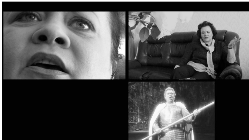
Kadras iš filmo „10“

Antanas Sutkus, fotografavęs ir oficialiai, ir į stalčių, apgailėstauja dėl kitų dalykų – kad šiandien jau nebėra to kaimo žmogaus, kurio veide galėjai išžvelgti lietuviškąjį mentalitetą. Jie išnyko kaip ir pats kaimas, kurio vietoje – arba plyni pamatai, arba Europos pinigais palaikomi stambūs ūkiai. Sutkaus albumai – negrįžtamai praeitin nuėjusio gyvenimo rezervatai.